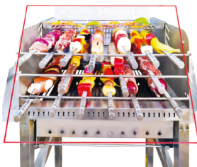
Multi Champ Churrasco Grill