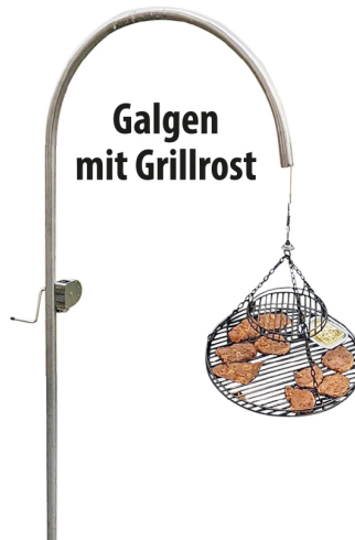
Galgen mit Grillrost

info@schneider-grillgeraete.de • www.schneider-grillgeraete.de