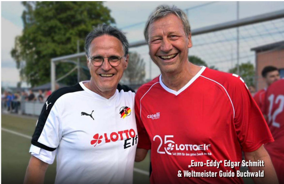
„Euro-Eddy“ Edgar Schmitt & Weltmeister Guido Buchwald