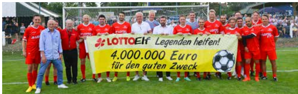
Ein Meilenstein: Über vier Millionen Euro für den guten Zweck.

Leidenschaft coacht: „Es ist mir eine Ehre, dazu beizutragen, dass vielen hilfsbedürftigen Menschen geholfen werden kann“, sagte er stolz.