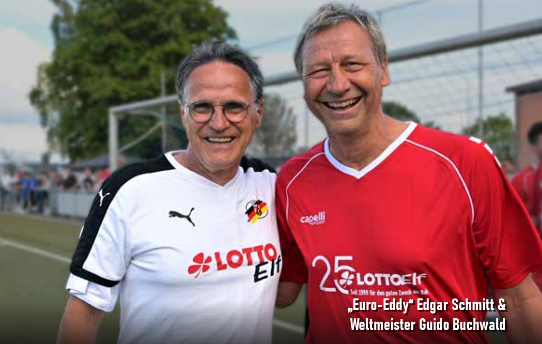
„Euro-Eddy“ Edgar Schmitt & Weltmeister Guido Buchwald